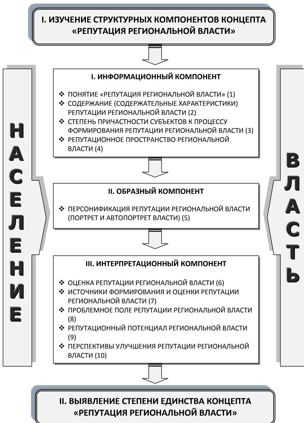
Рис. 2. Содержание исследовательской модели концепта «репутация региональной власти»